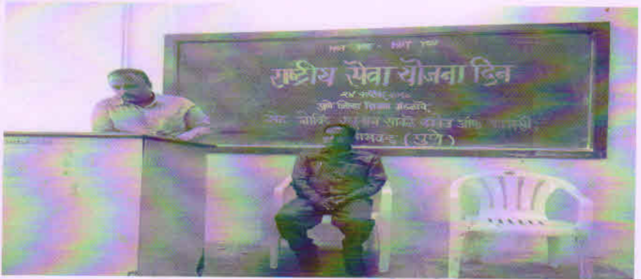
NSS Day Celebration