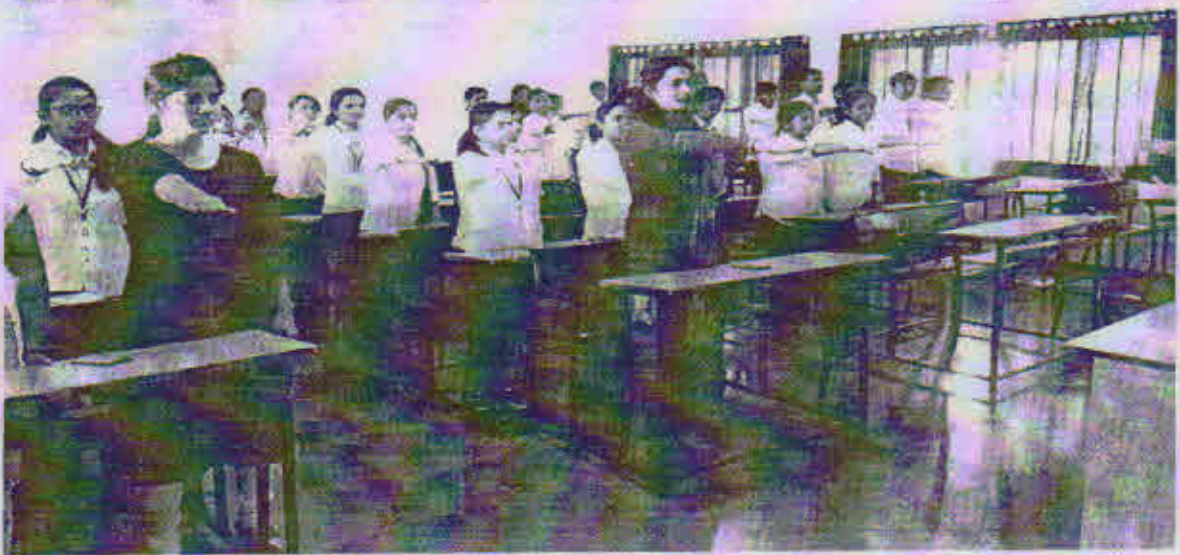
Rashtriya Ekta Diwas Pledge